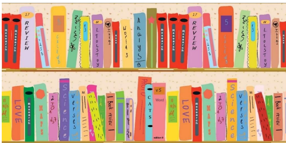
Illustration: Colourbox.de # 3672435

Das Institut für Film und Bild in Wissenschaft und Unterricht gGmbH (FWU) stellt seine Online-Mediathek bis zum 30. Juni 2020 kostenlos zur Verfügung. In der Mediathek sind mehr als 1.100 Unterrichtsfilm und über 5.000 Sequenzen für allgemeinbildende Schulen abrufbar. Daneben gibt es Arbeitsblätter, Bilder, Grafiken und Lernspiele.